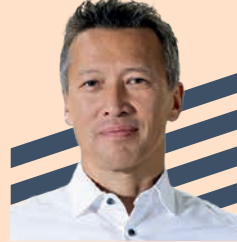
Dirk Hoke CEO, Volocopter GmbH