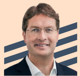
Ola Källenius CEO, Mercedes-Benz Group