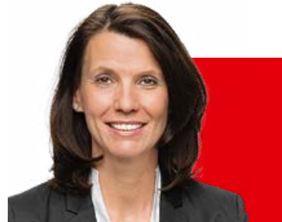
Rita Schwarzelühr-Sutter MdB Parlamentarische Staatssekretärin, Bundesministerium des Innern und Heimat