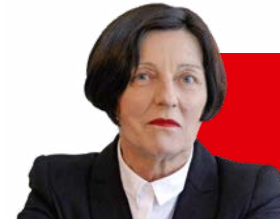
Herta Müller Schriftstellerin, Nobelpreis für Literatur

Einzigartige Momente und Inspiration im Carmen Würth Forum