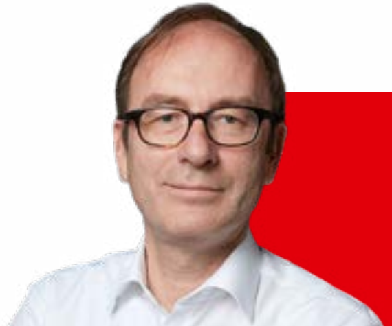
Beat Balzli Chefredakteur, WirtschaftsWoche